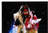
ミュージカル 「男鹿の於仁丸」