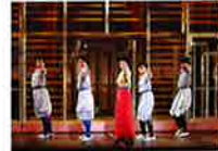
ミュージカル 「いつだって青空」