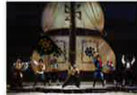
ミュージカル 「ジバング青春記」