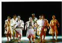
ミュージカル 「アテルイ」