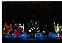
ミュージカル 「銀河鉄道の夜」