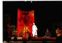
ミュージカル 「ブッダ」