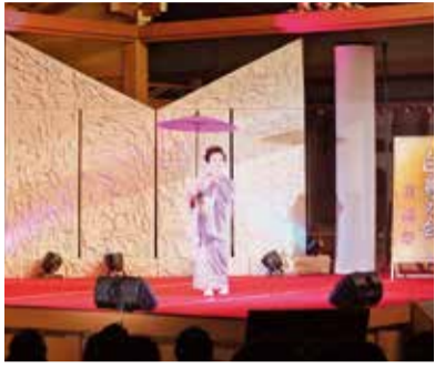
9月25日(日) 第3回 白鳥の会