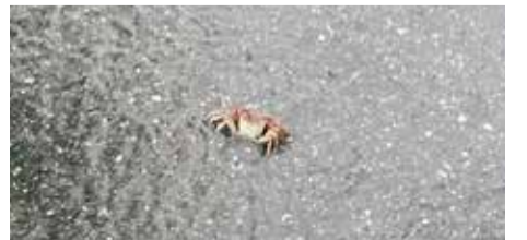
大雨の中お出かけ中のカニと遭遇しました。

このところ立て続けに台風が接近しましたが、みなさまは大丈夫でしたか？この記事を書いている最中も台風 18 号が接近しており、雨が強まったり弱まったりしています。ちなみにこの台風 18 号は「チャバ」という名前で、タイ語でハイビスカスのことだそうです。台風の名前には日本語の候補もあるそうなのですが、あまり日本語の名前を聞いたことが無いのでどこか別の国に行っているのでしょうか。